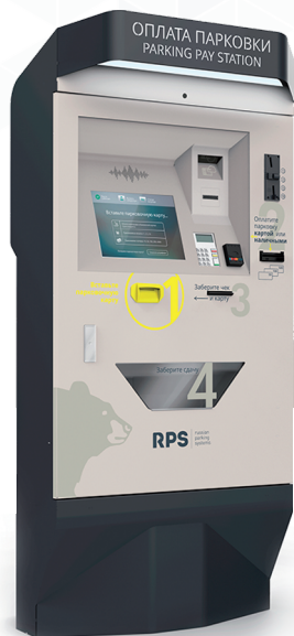
КАССА RPS STANDARD