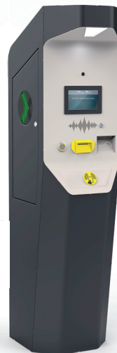
СТОЙКА ВЪЕЗДА RPS STANDARD