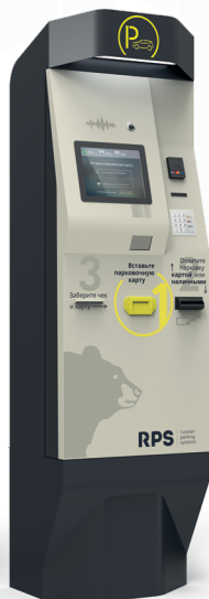
КАССА RPS LIGHT