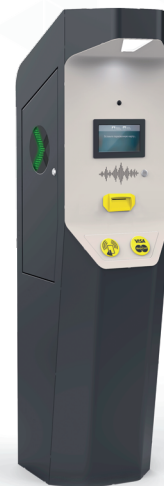
СТОЙКА ВЫЕЗДА RPS STANDARD